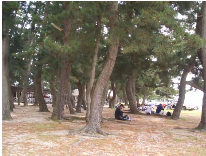
近江白浜にて昼食