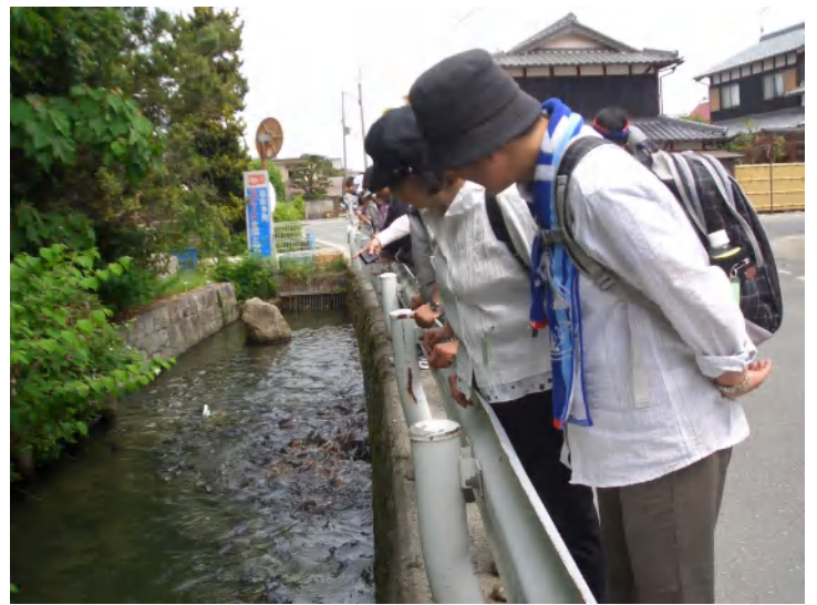
下小川地区の小川を観察：たくさんの魚にみなさん大喜び・・・・・・・・