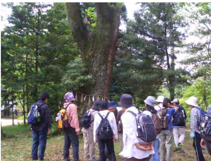
樹齢400年のダマの木を観察