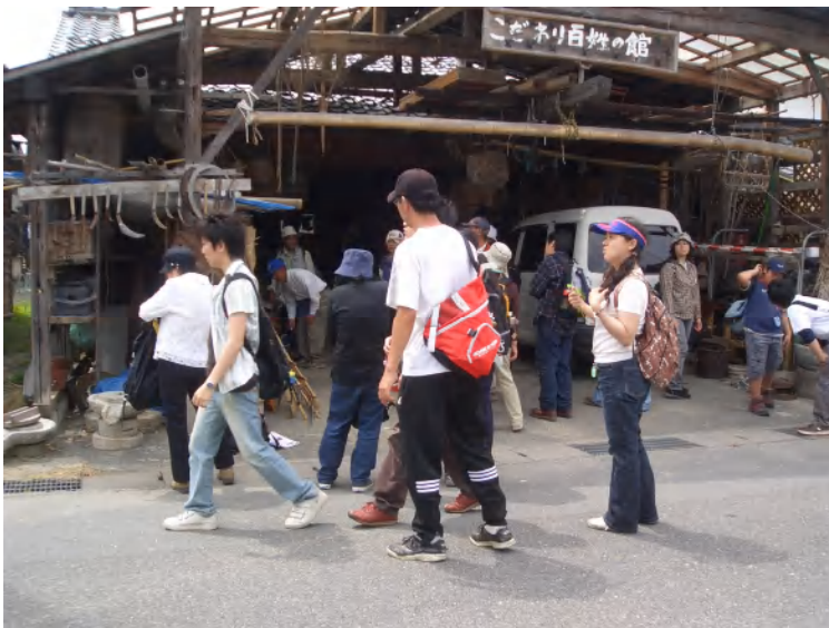
こだわり百姓の館にて