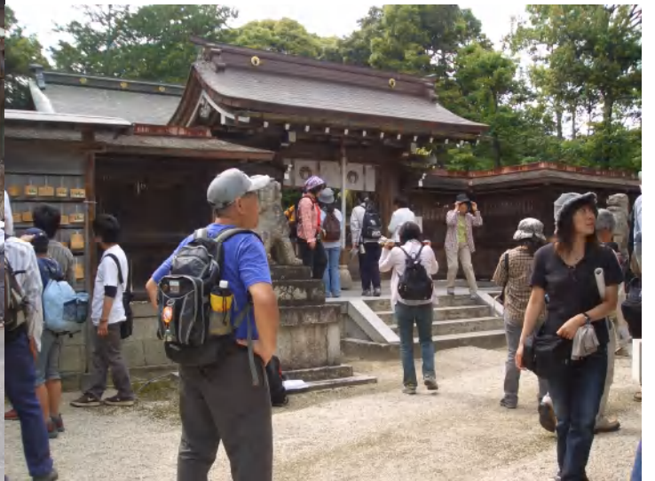
中江藤樹神社参拝