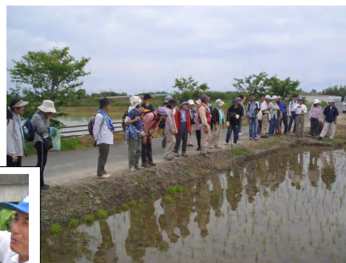
古代米田：手前/赤米 向こう/黒米