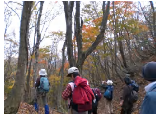
みごとな紅葉に…撮影タイムです。