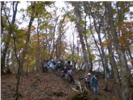
みごとな紅葉の中をウォーキング・・・るんるん山歩です。