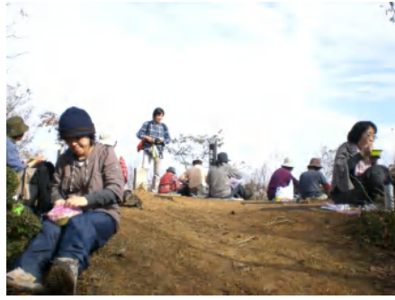
頂上にてお弁当です。