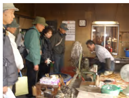
扇子の第一工程を見学させていただきました。