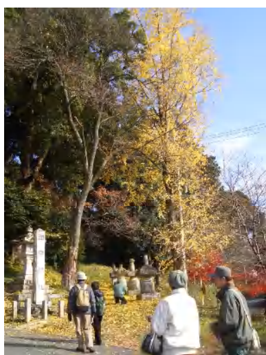
田中神社の銀杏：風に吹かれ、きれいに舞い落ち・・・写真を撮られるお客さん