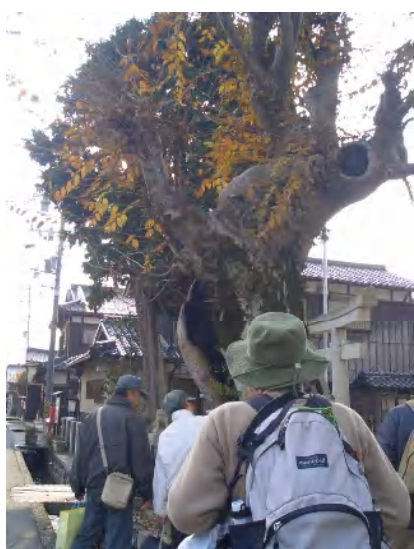
天満宮のケヤキの巨木を観察される皆さん。 つけているので、びっくり。