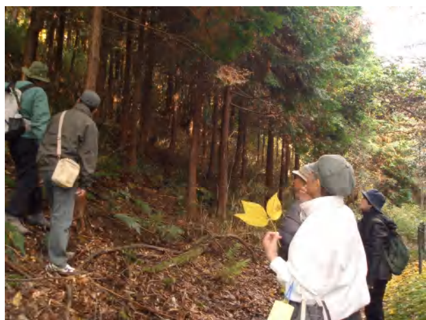
樹木の皮が、傷ついています。「きっと鹿だろう。熊だったら・・・」と、熱心に自然観察されています。