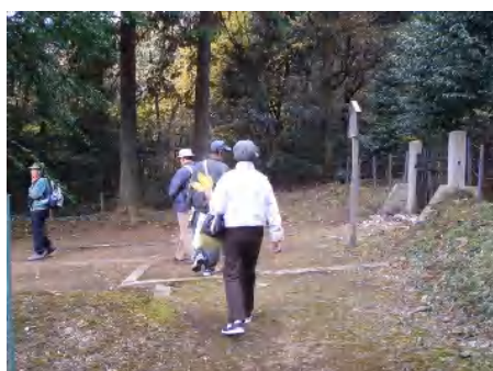
彦主人王御陵を見学して