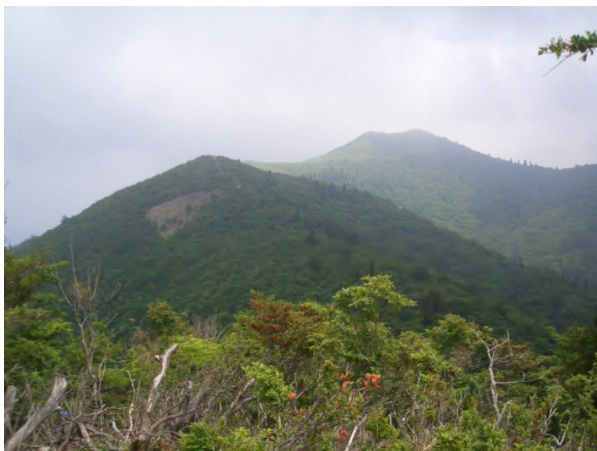
御殿山からの武奈ヶ岳