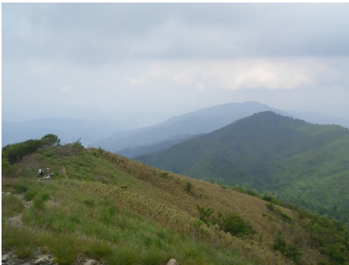
武奈ヶ岳山頂（1214m）からの釣瓶岳・蛇谷ヶ峰