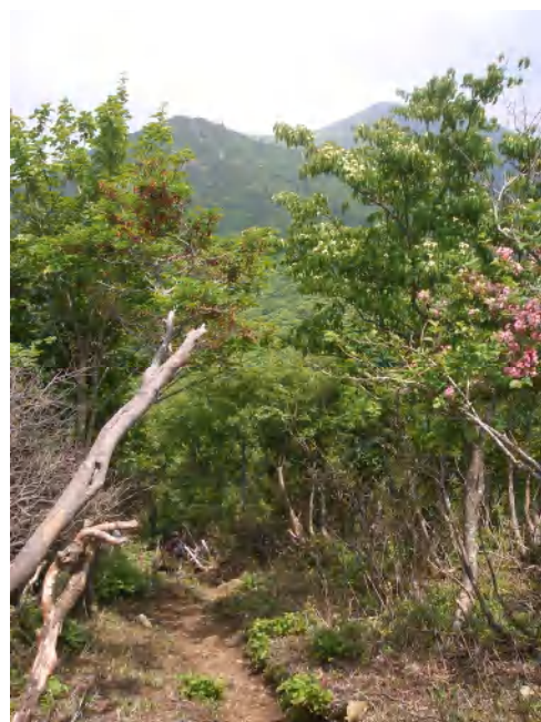
御殿山頂上からのコース