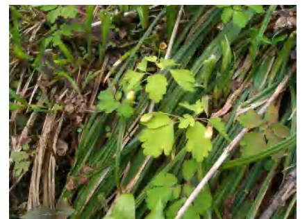
サンインシロガネソウ