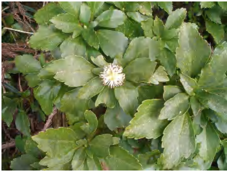
名前を教えてください。