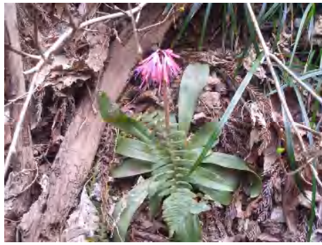
ショウジョウバカマ