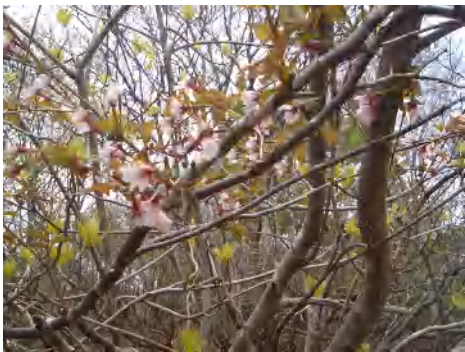
キンキマメザクラ