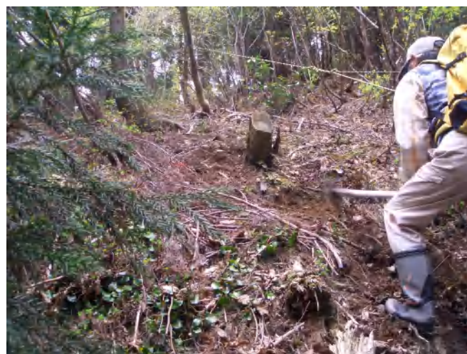
スギが折れていました。横にいざらせていただきました。