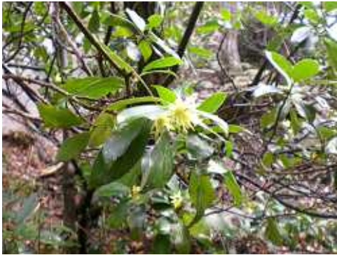
シキミの花：あちこちに咲いていました。