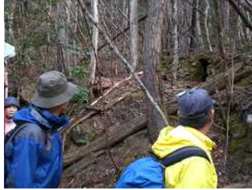
右上：炭焼き窯が、きれいに残っています。雨が上がり、衣服の調整・・・