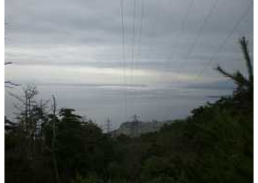
鉄塔からの眺望：今日は遠くまで見え最高・・・ルンルン・・・。