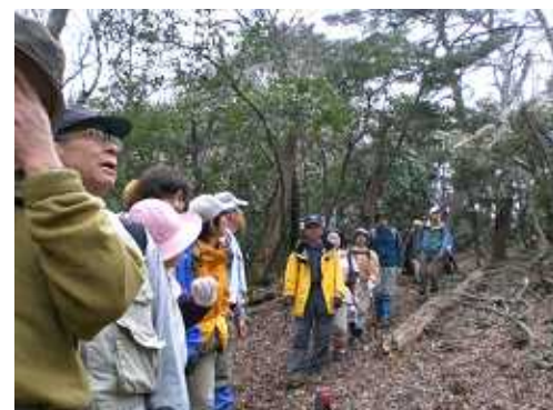
アセビ・ヒサカキ・シキミ・マンサクの花々が満開です。