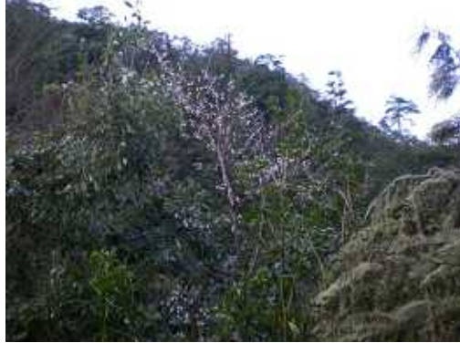
キンキマメザクラ