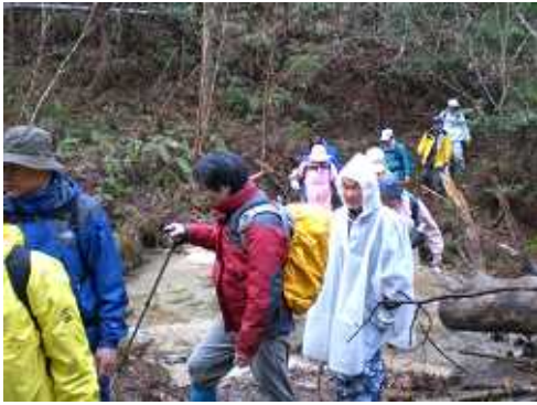
澤を渡って・・・

朝から、雨が降っていましたが、25分ほどであがり、早春の花々・眺望・歴史探訪を楽しみました。帰り道、3時過ぎから、また雨が降りだし、近江高島駅には、3時35分ごろ帰ってきました。