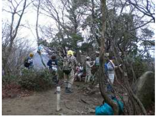
岩阿沙利山にて：眺望を楽しむ小休止