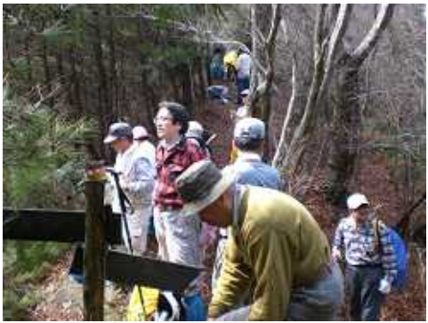
鵜川越：琵琶湖の眺望とさわやかな風を楽しむ