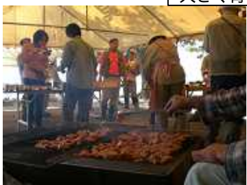
竹炭で「とんちゃん」焼きを食す 2009,5,31 タケノコ狩にて