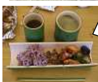
収穫したタケノコを使って、かぐや姫ご膳をご笑味