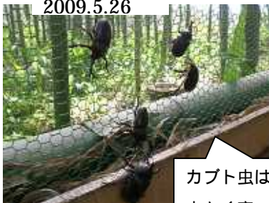
カブト虫は、こんなに大きく育っています