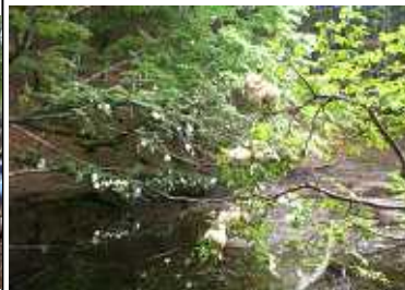
モリアオガエルの卵