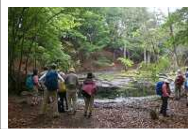
神秘的な山上の池

横谷峠～山上の池～駒ヶ越～駒ヶ岳～与助谷山～木地山を山歩。横谷峠の林に入るなり、ハクウンボクの花がちょうど満開できれいでした。神秘的な山上の池では、たくさんのモリアオガエルの卵にビックリです。高島市が誇るブナ原生林を「ブナ林は、やはり違うね . . .」と言いながらゆっくり散策。駒ヶ岳のブナの木の色づけには、ちょっぴり残念です。ヤマボウシ・ヤブデマリ・タニウツギ・サワフタギ・カマツカ・ギンリョウソウなどたくさんの花々に出会い皆さんルンルンです。素晴らしい眺望・自然観察を楽しみました。