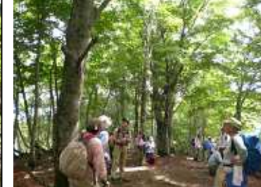
ブナ原生林「今年は、ブナの実が多いね」 ハクウンボクの花が満開