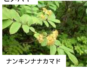
ナンキンナナカマド