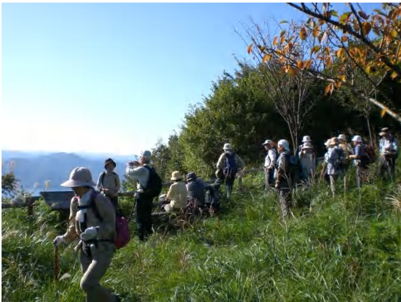
山本山から、すばらしい眺望を楽しまれる皆さん。