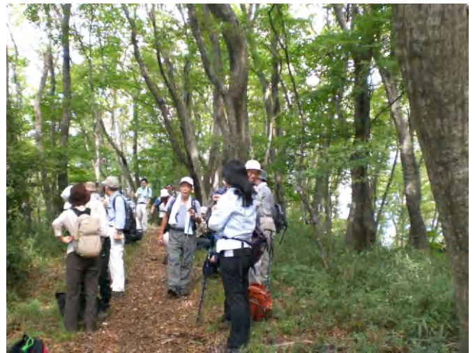
綺麗な自然林で、ちょっと一服です。