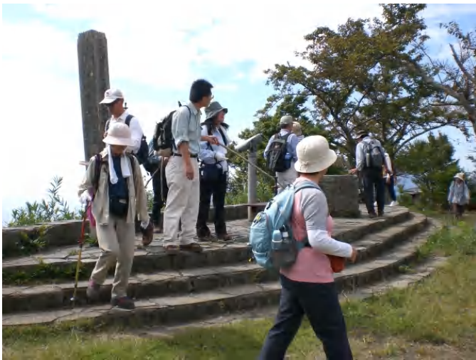
賤ヶ岳からの眺望を楽しみました。