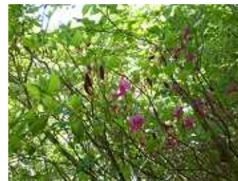
ユキグニミツバツツジ