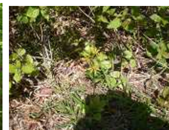
ショウジョウバカマの種