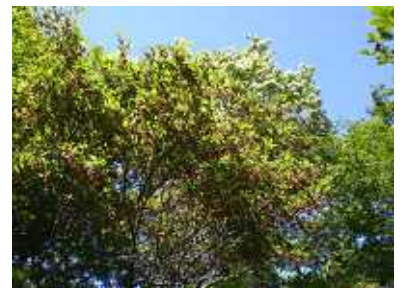
アオダモとベニドウダン